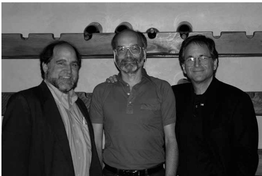
De gauche à droite : Rivest, Shamir et Adleman, les « pères » de RSA.

Quand les clés de codage-décodage sont similaires, on parle de système symétrique . Dans les années 1970, l'algorithme DES était utilisé ; on lui donnait alors une durée de vie d'une quinzaine d'années. Il a résisté remarquablement longtemps, et son obsolescence est née de la trop petite taille de sa clé, longue de 56 bits . Il a été remplacé dans les années 2000 par AES, à la clé longue de 128 à 256 bits . Ces systèmes sont très puissants et robustes, et les opérations de codage-décodage s'exécutent relativement vite sur des machines dédiées, rendant leur usage facile. Deux schémas à clés secrètes sont particulièrement élémentaires : la transposition des lettres de l'alphabet, et l'entrelacement des lettres du texte à transmettre. En voici un troisième, adapté aux trames binaires (b_n)_{n \geq 0} , comme par exemple un flux de données sons ou un flux de données images. Les suites récurrentes linéaires sont un classique de l'arithmétique. D'habitude, les coef-