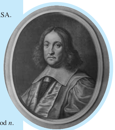
Pierre de Fermat, par François de Poilly.

L'entier x n'excédant pas n , on a exactement (x^e \bmod n)^d = x .